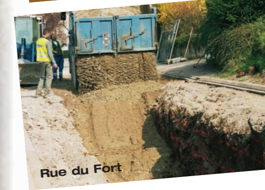
Rue du Fort