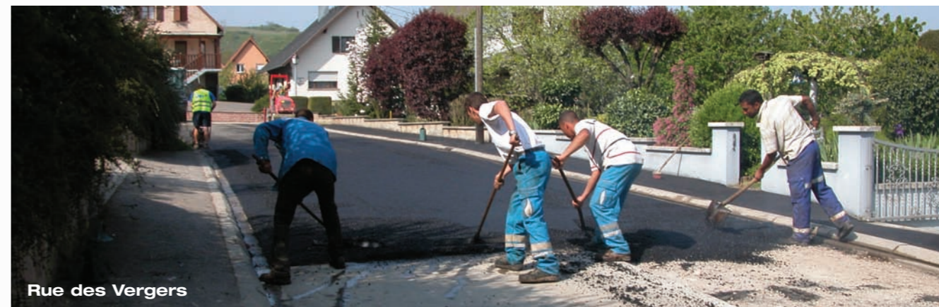
Rue des Vergers