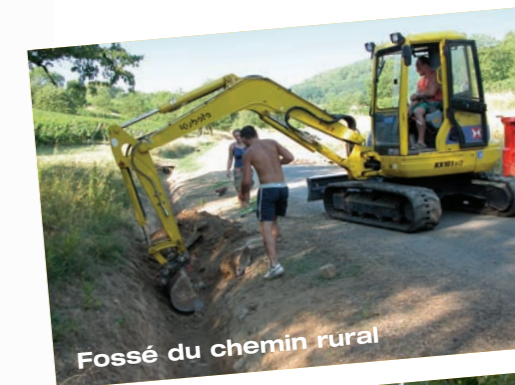
Fossé du chemin rural

Chemin du Moulin Rue des Sœurs Place Charles De Gaulle Rue Belle Vue Rue Emma et Dorette Muller (réseaux)