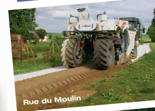
Rue du Moulin