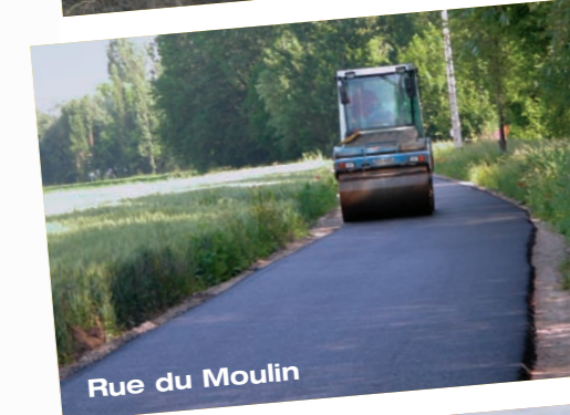
Rue du Moulin