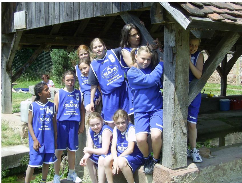
Les benjamines de Soultz-les-Bains