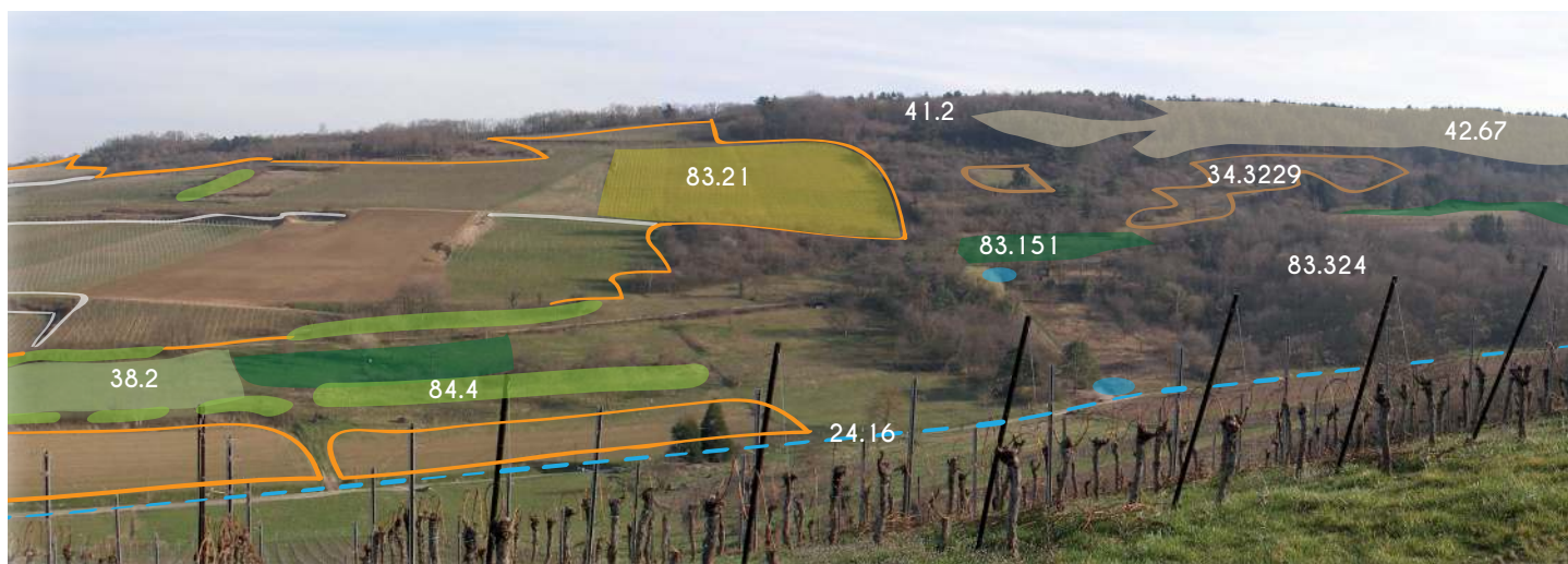
Photographie du Jesselsberg depuis la crête de Dangolsheim. Codes issus du rapport de la typologie Corine biotopes (version originale) - Types d'habitats français.