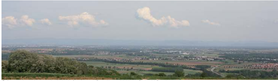
De gauche à droite: cathédrale de Strasbourg - Forêt-Noire - Malsheim.