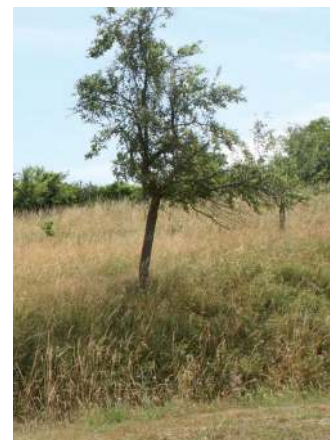
© Deux habitats se chevauchent: prairie mésophile et verger. Photographie: M. Föegle.

A chaque grand paysage, l'on attribue un chiffre (code) de 1 à 7. Le type de milieu recherché est plus rapide.